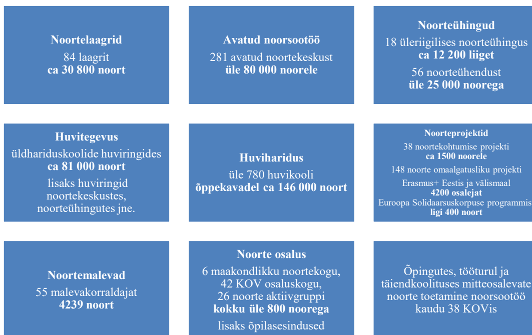
Joonis 1. Noorsootöös osalemise võimalused 2019. aasta andmetel

Noorte osalemine noorsootöö tegevustes on aasta-aastalt kasvanud. Kui 2010. aastal oli erinevatesse tegevustesse kaasatud 37% noortest vanuses 7-26-eluaastat, siis 2019. aastal juba 59,9%. Osaluse tõusu on positiivselt mõjutanud nii osalejate kõrgem aktiivsus kui noorsootöö võimaluste pakkujate arvu kasv. Näiteks huvikoolide, s.o noortevaldkonnas tegutsevate huviharidust pakkuvate asutuste arv, on perioodil 2009-2019 kasvanud enam kui kaks korda – 363-lt 780-le. Avatud noortekeskuste ehk avatud noorsootööd pakkuvate noorsootööasutuste arv on tõusnud samal perioodil 222-lt 281-le. Võrreldes huvikoolidega on just avatud noortekeskused noortele kättesaadavamad maapiirkondades. Ühes noorsootöö teenustega on kasvanud ka noortevaldkonna töötajaskond, keda 2019. a seisuga on üle 9000.